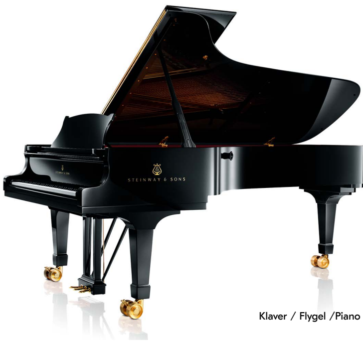
Klaver / Flygel / Piano