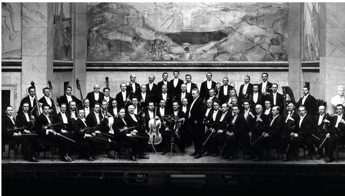
Filharmoniske Selskap, 1919.